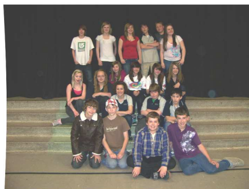
Radio étudiante 2010-2011